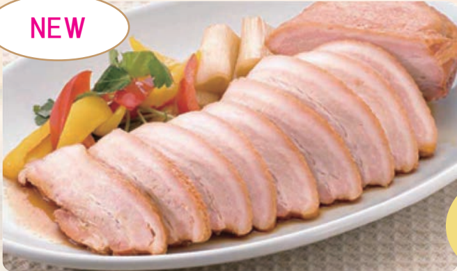
豚ばらチャーシュー

900g~1.7kg/パック 100gあたり 160円 (税込 172円) ※大きさごとに価格が異なります。