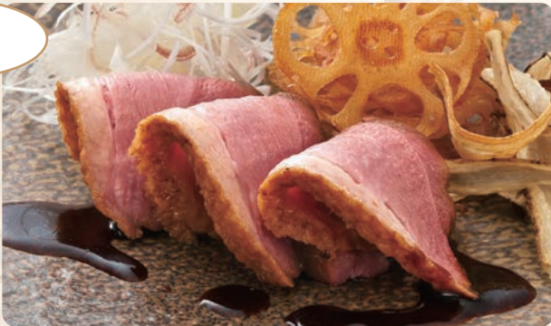
合鴨和風ロースト