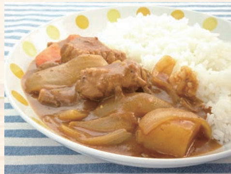
シチュー用ビーフ 20/25 カレーに最適!

ホテル・レストランで使用されている商品を 解凍して温めるだけで簡単に自宅でお店の味を楽しめます 料理のプロの考えるアレンジレシピも大公開☆ 大好評の調理ノートも店頭で配布しています メニューに悩んだら「いちまるマルシェ」へ! お気軽にご相談ください♪