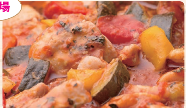
若鶏のプロヴァンス風煮込み