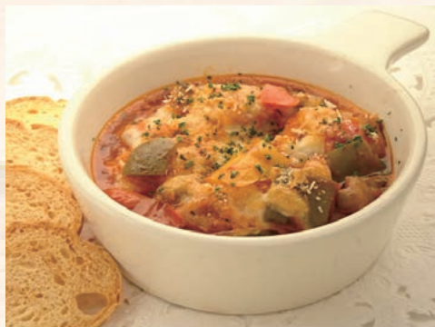
若鳥のプロヴァンス風煮込みグラタン風にアレンジ!