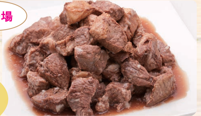
シチュー用ビーフ 20/25