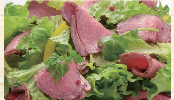
ローストビーフ(もも肉)

300g以上/パック | 100gあたり 300円 (税込324円) ※大きさごとに価格が異なります。