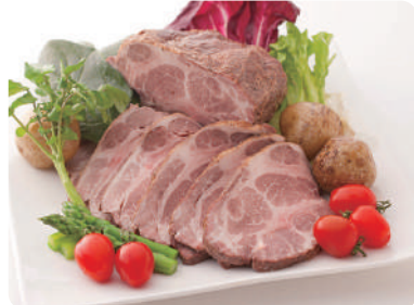
イベリコ豚ローストポーク 300~700g/パック 100gあたり 400円 (税込432円) ※大きさに価格が異なります。