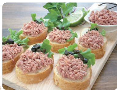
合鴨ロースト黒こしょう風味 約190g/パック 700円 (税込756円)