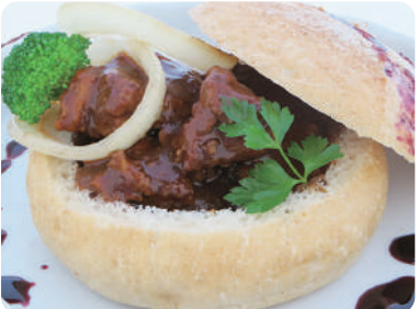
赤ワイン風味ビーフシチュー 500g/パック 1,800円 (税込1,944円)