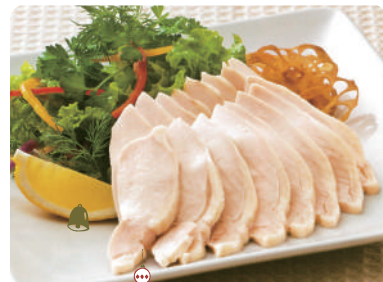
ホワイトチキン 定番商品 170~300g/パック 100gあたり 140円 (税込151円) ※大きさに価格が異なります。