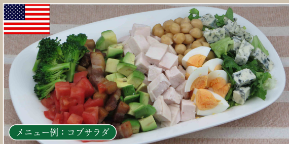
メニュー例：コブサラダ

驚くほどニンニクをたっぷり使った鶏肉のクリームシチュー。ジョージア大使館の方達も納得した本場の味をお試しください。